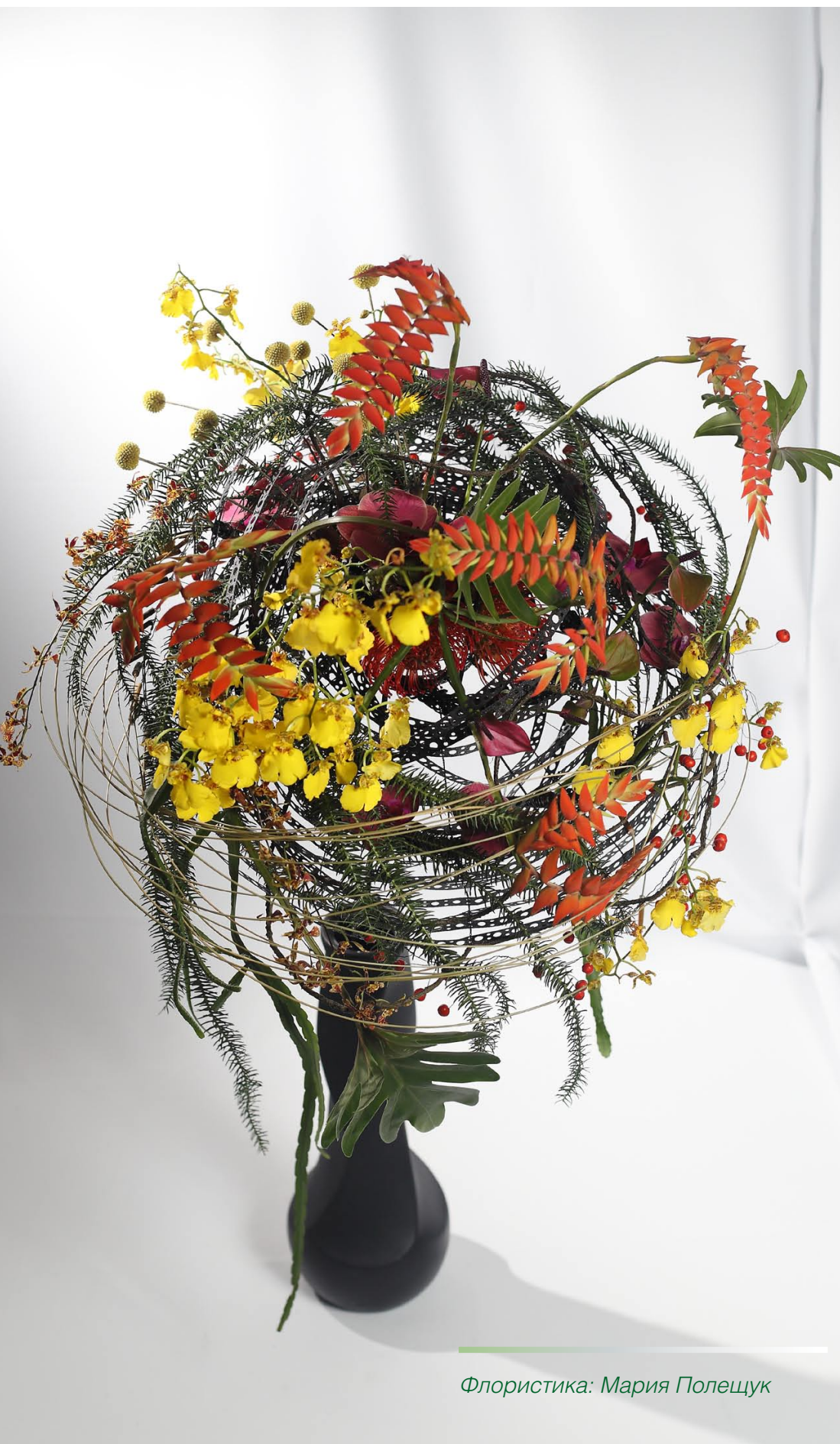
Флористика: Мария Полещук