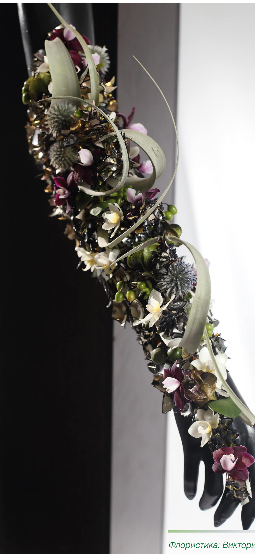
Флористика: Виктория Гаврилина